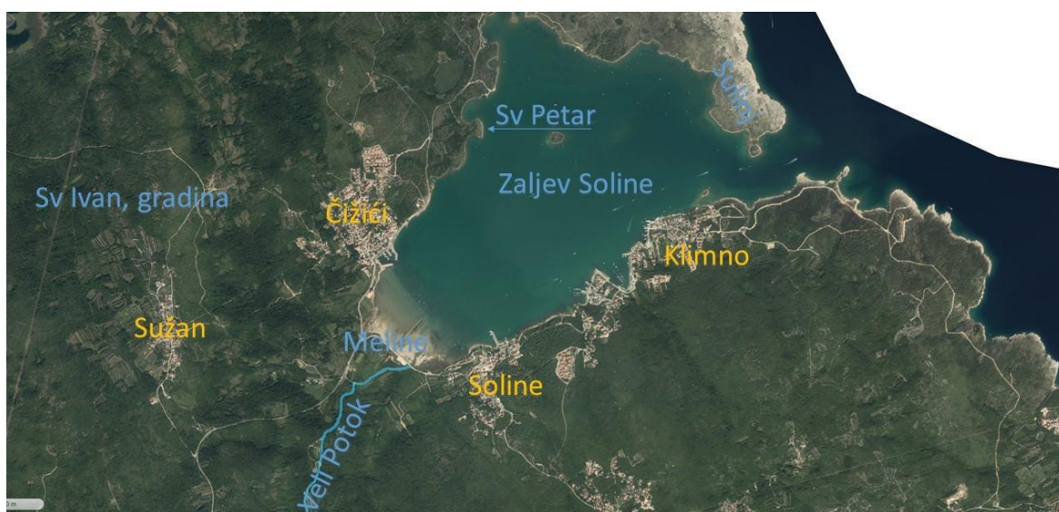
Slika 1 – Uvala Soline s toponima koji se spominju u tekstu (plavo) i današnja naselja (žuto)

Smatra se da je na području Melina još u antici postojala solana. U srednjem vijeku, solane su držali krčki knezova Frankopani (Bradanović 2012: 142-143 s ranijom literaturom). Frankopanima je solane 1. studenog 1412. godine, potvrdio sam Hrvatsko-ugarski kralj Sigismund. Antonio Vinciguerra, koji je bio venecijanski upravitelj otoka, piše da solana proizvodi "izvanrednu sol" ( saline excellentissime ). O solani piše i Augustin Valerije u svom izvješću iz 1527. godine. O važnosti solane svjedoči i činjenica da su u srednjem vijeku sela Soline, Sužan i Šugare činile zasebnu administrativnu jedinicu s posebnim sucem. Padom otoka Krka pod vlast Mletačke Republike 1480. g. solane su zatvorene kako ne bi konkurirale venecijanskim solanama