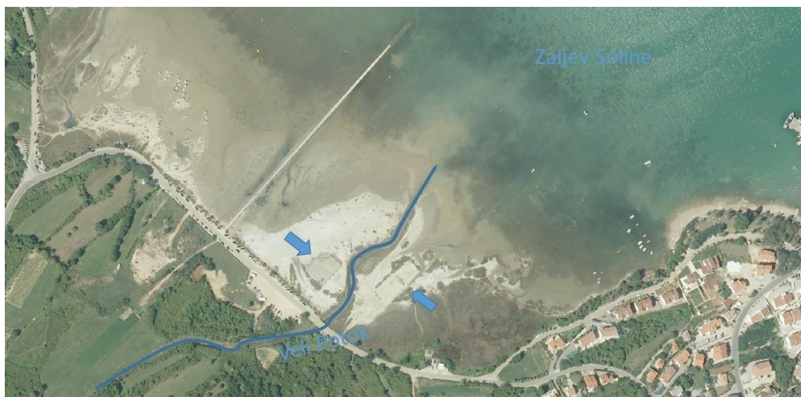
Slika 3 – Zapadni dio uvale Soline, Meline s ostacima solana (strelice) na ušću Velog potok

Drugi dio istraživanja posvećen je uvali Sv. Petar unutar uvale Soline. Već ranije je kolegica Lipovac Vrkljan utvrdila postojanje ostataka keramičarke djelatnosti iz antičkog doba i pretpostavila postojanje lučkih objekata (Lipovac Vrkljan, Starac 2007). Na snimkama smo utvrdili četiri ostatka pristaništa (Sl. 4) koji su danas pod vodom (zbog podizanja razine mora od antičkog vremena za 1,5-2m). U blizini uvale Sv. Petar prema sjeveru nalazi se Jezero vjerojatno veća lokva. Zanimljivo je jer lokve obično nastaju na mjestu gdje se taloži glina koja onda zbog nepropusnosti zadržava kišnicu čineći lokvu/Jezero (Sl. 4). Zbog svoje veličine mogla je služiti kao izvorište gline za keramičarsku proizvodnju.