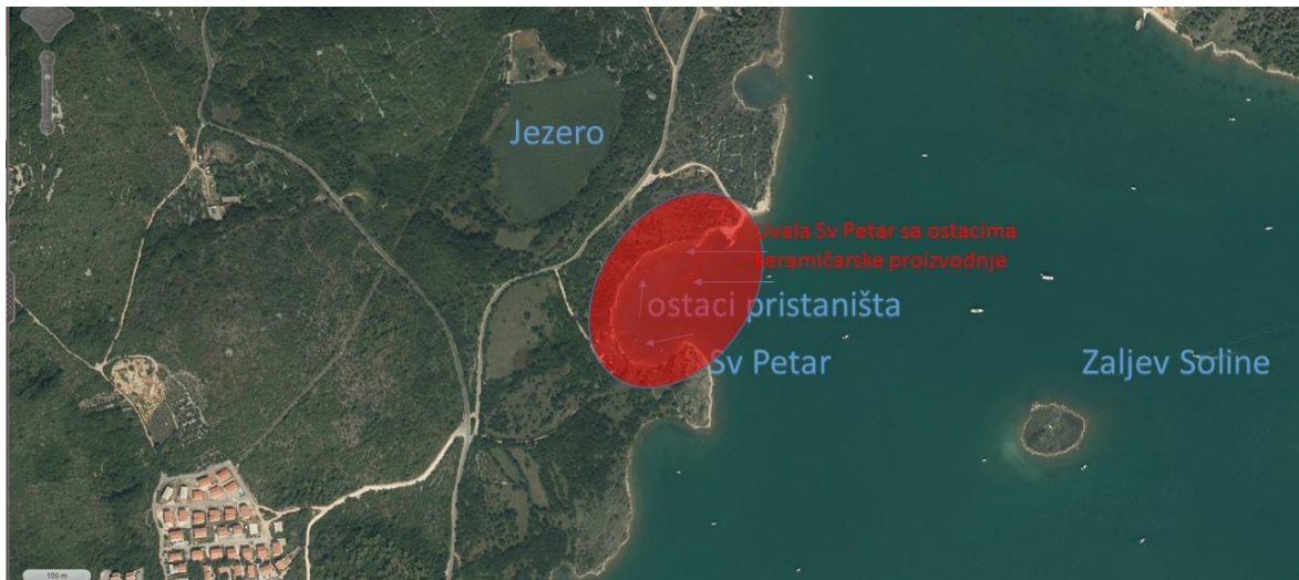
Slika 4 – Uvala Sv. Petar s označenom crkvom, pristaništima i područjem keramičarske radionice

Dakle, u uvali Soline nalazimo sve osnovne preduvjete za keramičarsku proizvodnju: glina iz lokve Jezero, voda iz Velog potoka, šuma kojom ovo područje obiluje, povezanost s tržištem preko dobrog sidrišta u uvali Sv. Petar, ali i blizina Omišlja odnosno Fulfinija rimskog municipija na zapadnoj strani otoka (Čaušević Bully, Valent 2015) s kojim je sigurno postojala i kopnena veza. O dodatnom značaju ovoga područja govori i koncentracija prethistorijskih gradina u bližoj okolini uvale Soline (do 3 km zračne linije): Sv Ivan kod Sužna (Sl. 5), Dobrinj, gradina Županja, Gračište kod Sv. Ivana Dobrinjskog. 1