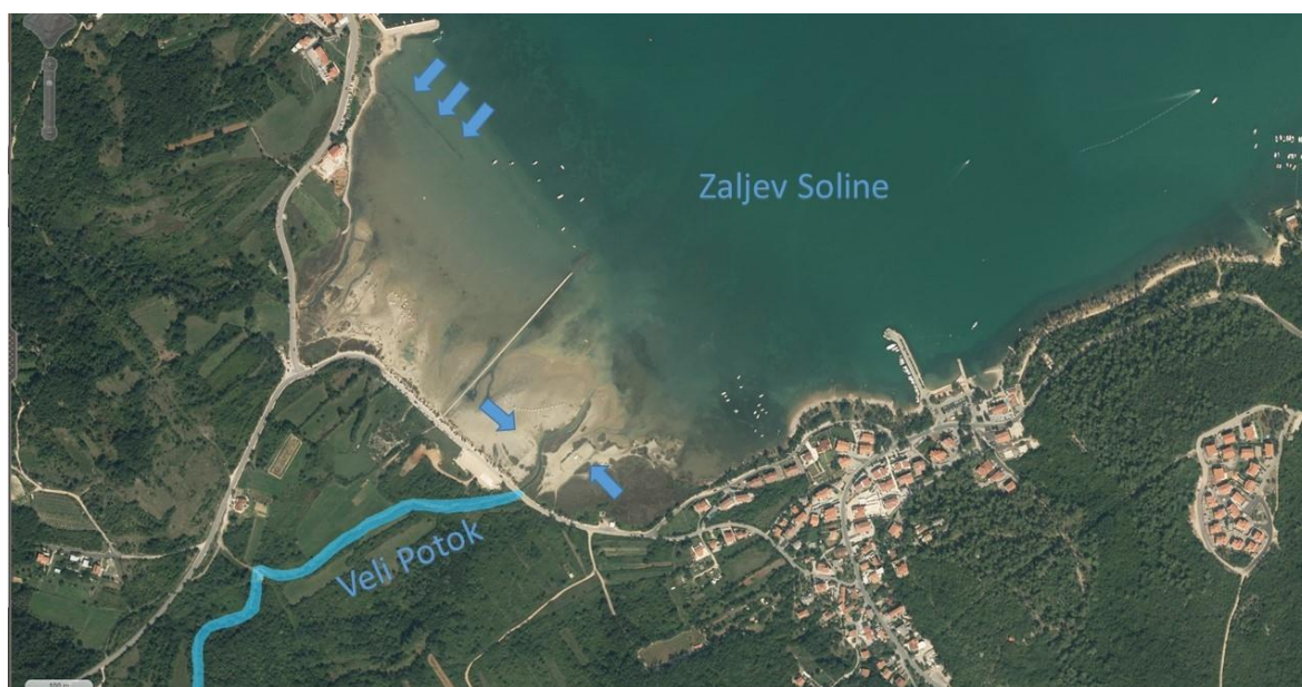
Slika 2 – Zapadni dio uvale Soline, Meline s ostacima solana (strelice)

Za daljinsko istraživanje koristili smo zračne snimke Državne geodetske uprave Republike Hrvatske. Snimci su dostupni na mrežnim stranicama Geoportal i ARKOD. Korišteni su i snimci sa stranica Ministarstva graditeljstva i prostornog uređenja. To su snimci nastali prije 1968. g. gdje su zbog značajno manjeg biljnog pokrova vidljivi arheološki ostaci na području okoline uvale Soline. Također su korišteni i snimci s mrežnih stranica Google Earth koji su cijelim nizom snimaka iz različitih godišnjih perioda omogućili vidljivost pojedinih struktura pod morem i na obalama zaljeva.